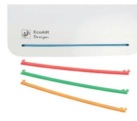
Wymienne listwy dostępne w czterech kolorach: niebieski, czerwony, zielony i żółty.