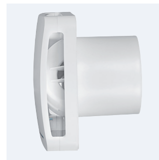
Antywibracyjne mocowanie silnika zapobiega przenoszeniu drgań i hałasu.