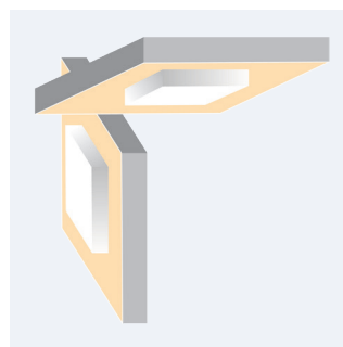
Instalacja w ścianie lub w suficie